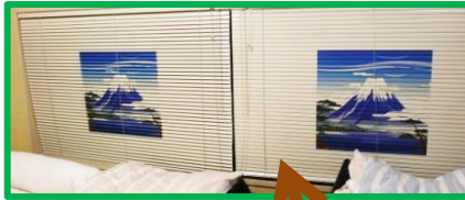
富士山が見える静養室です。

12月にフロア全体の模様替えを行いました。下記○印付近の有効活用ができていなかったスペースを見直しました。空間が広がり、動きやすくなりました。