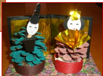
今年のお雛様は松ぼっくりを使って作りました。