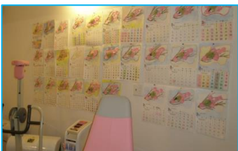
機能訓練室でウグイスがホ～ホケキョ♪