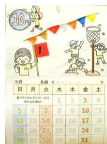
10月カレンダー↓運動会がテーマです。