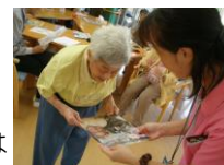
敬老のお祝いのプレゼントは