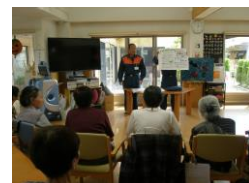
緑消防署の方が来ていただきました。